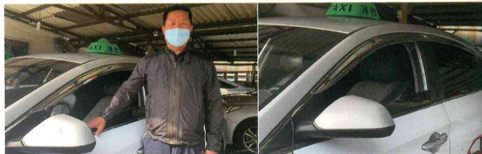
차종 : LF쏘

오토클로바 도어 바이저를 사용하시면서 가장 만족스러운 점은 어떤게 있었나요? 흡연하면 차 안에 냄새가 남는데 도어바이저를 붙이고 난 뒤에는 냄새 안 남게 바로 창문 열어서 환기 시키고 좋습니다, 만족합니다.