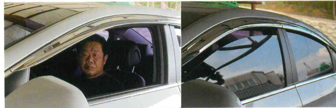
차종 : LF쏘

비 올 때 빗물이 되는건 기본이고 우선 반짝반짝 예뻐요. 또 오토클로바제품은 6피스라서 차 맨 끝 창문까지 쪽~ 이어지니까 원래 있었던 거 마냥 참 예뻐더라고요.