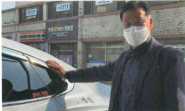
차종 : 그랜저IG