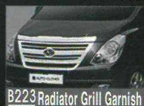
B223 Radiator Grill Garnish