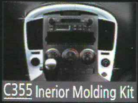
C355 Interior Molding Kit