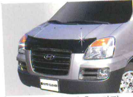
〈스타렉스/아크릴 후드 가드〉