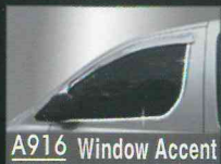
A916 Window Accent