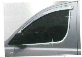
〈그랜드 스타렉스(2007)/ 윈도우 액센트〉