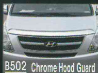
B502 Chrome Hood Guard