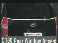
C180 Rear Window Accent