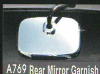
A769 Rear Mirror Garnish