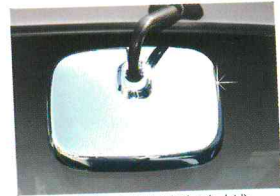
〈스타렉스/리어 미러 가니쉬〉