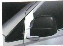
〈그랜드 스타렉스/미러 브라켓 몰딩〉