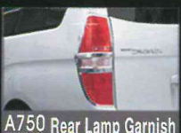
A750 Rear Lamp Garnish