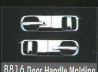
B816 Door Handle Molding HOLE