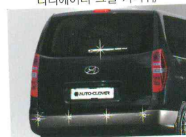
〈그랜드 스타렉스/리어 몰딩 키트〉