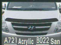
A721 Acrylic B022 San Hood Guard