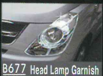
B677 Head Lamp Garnish