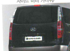
〈그랜드 스타렉스/ 리어 필러 몰딩(크롬)〉