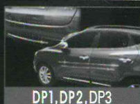
DP1, DP2, DP3