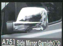
A751 Side Mirror Garnish