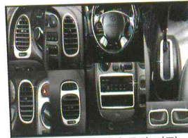
〈스타렉스/인테리어 몰딩 키트〉