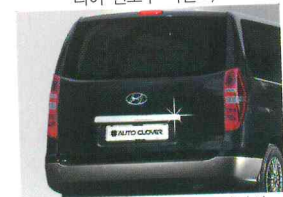
〈그랜드 스타렉스/트렁크 가니쉬〉