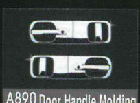
A890 Door Handle Molding HOLE