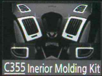
C355 Interior Molding Kit