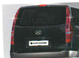
〈그랜드 스타렉스/ 리어 필러 몰딩(레드)〉