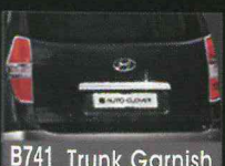
B741 Trunk Garnish