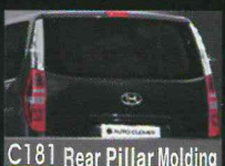
C181 Rear Pillar Molding Chrome