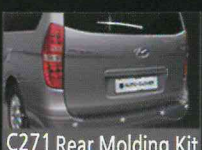
C271 Rear Molding Kit