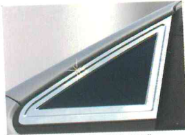
〈스타렉스/A 필러 몰딩〉