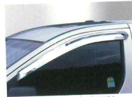
〈그랜드 스타렉스(2007)/ 크롬 도어바이저〉