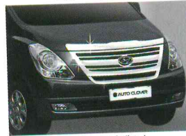
〈그랜드 스타렉스/ 라디에이터 그릴 가니쉬〉