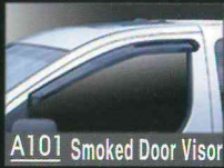
A101 Smoked Door Visor

MAKE : HYUNDAI MODEL : GRAND STAREX, H-1, 그랜드 스타렉스 YEAR : 2007~Current