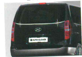
〈그랜드 스타렉스/ 리어 윈도우 액센트〉