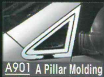
A901 A Pillar Molding