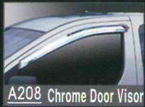
A208 Chrome Door Visor