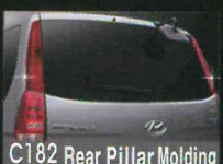
C182 Rear Pillar Molding Red