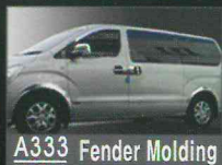
A333 Fender Molding