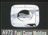
A972 Fuel Cover Molding