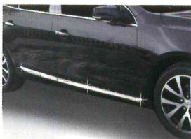
〈MB(2011)/사이드 스커트 액센트〉