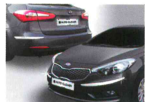
〈K3(2012)/크롬 범퍼 몰딩〉