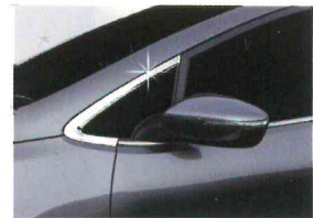
〈K3(2012)/A 필러 몰딩〉