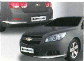
〈MB(2011)/크롬 범퍼 몰딩〉