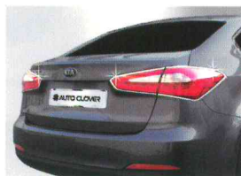
〈K3(2012)/리어 램프 가니쉬〉