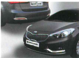
〈K3(2012)/포그 램프 가니쉬〉