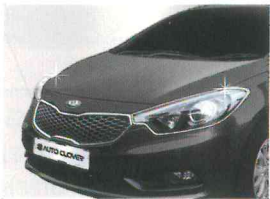
〈K3(2012)/헤드 램프 가니쉬〉