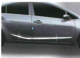
〈K3(2012)/사이드 스커트 액센트〉